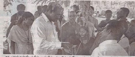
தா. பழர் ஒன்றியத்தில் அன்பில் தம்மலிங்கம் வேளாண் கல்லூரி மாணவிகளின் சாப்பில் நடைபெற்ற நிலக்கடலை முன்பருவச் சாகுபடி முகாமில் விவசாயிகளுக்கு விளக்கமளிக்கும் மாணவிகள்.

அரியலூர், ஆகஸ்ட் 9: அரியலூர் மாவட்டம், தா. பழர் ஒன்றியத்தில் நிலக்கடலை முன்பருவச் சாகுபடி முகாம் அண்மையில் நடைபெற்றது.